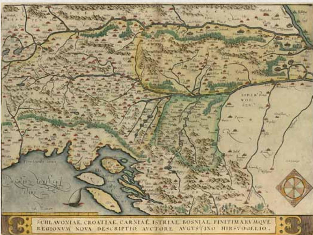
Augustin Hirschvogel. Schlavoniae, Croatiae, Carniae, Istriae, Bosniae . Antwerpen, 1573.

Prof. dr. Drago Novak držao se sljedećih kriterija za odabir i nabavu građe: karte prikazuju u cijelosti ili dijelom dio hrvatskoga povijesnog prostora, koji se od XVI. do XX. stoljeća nalazio pod vlašću neke od susjednih imperijalnih sila, i autor ili kartograf karte je hrvatskog podrijetla. Ti su kriteriji osigurali da je fond Zbirke Novak, Mappae Croaticae , kako i sam naziv kaže, još jedna vrijedna hrvatska zbirka, kartografska Croatica .