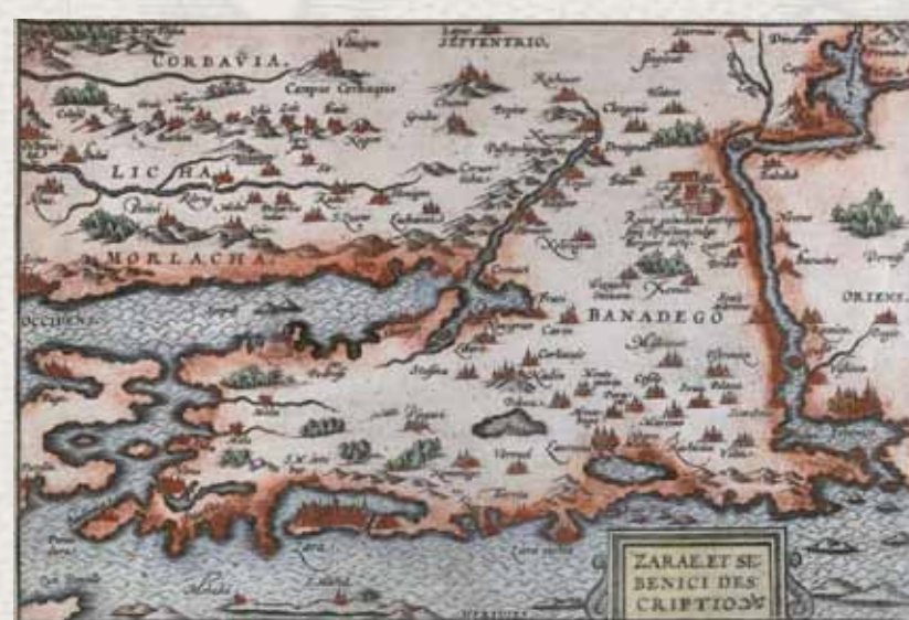
Natal Bonifacij. Zarae et Sebenici descriptio . Antwerpen, o. 1575.