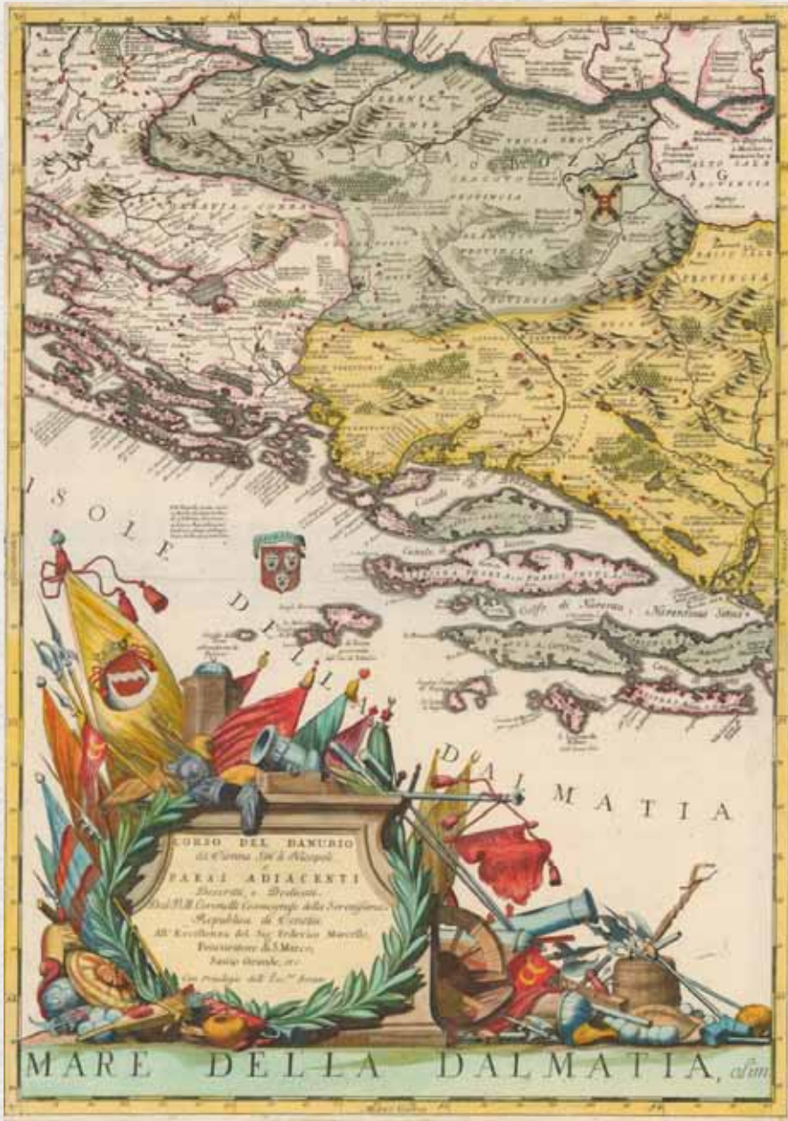
Vincenzo Maria Coronelli. Corso del Danubio da Vienna... Mare della Dalmatia . Venezia, 1696.