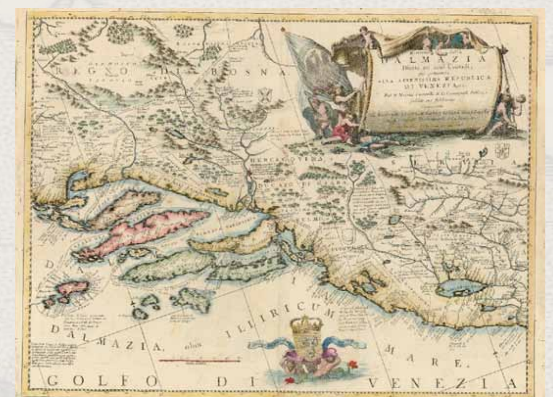
Vincenzo Maria Coronelli. Ristretto dell'a Dalmazia diuisa ne suoi contadi . Venezia, o. 1690.