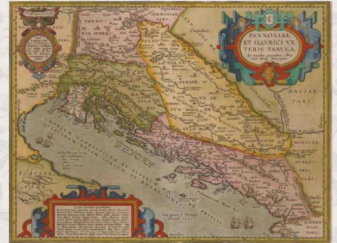
Abraham Ortelius. Pannoniae et Illyrici Veteris tabula . Antwerpen, 1590.

Zbirka zemljopisnih karata i atlasa NSK u svojoj gotovo sedam desetljeća dugoj povijesti prikupila je veliki broj karata i atlasa (o. 40.000 jedinica građe). Cjelokupan fond je obrađen i dostupan korisnicima. Najvrjednija građa, stare karte prostora Hrvatske XVI.–XIX. stoljeća, digitalizirana je. U planu je i digitalizacija ostale vrijedne kartografske građe, kao što su rukopisne karte i stari atlasi. Nabava i obrada starih karata Hrvatske aktivnost je Zbirke već niz godina, a planira se nastaviti i u budućnosti istraživanjem i nadopunjavanjem fonda hrvatske kartografske kulturne baštine.