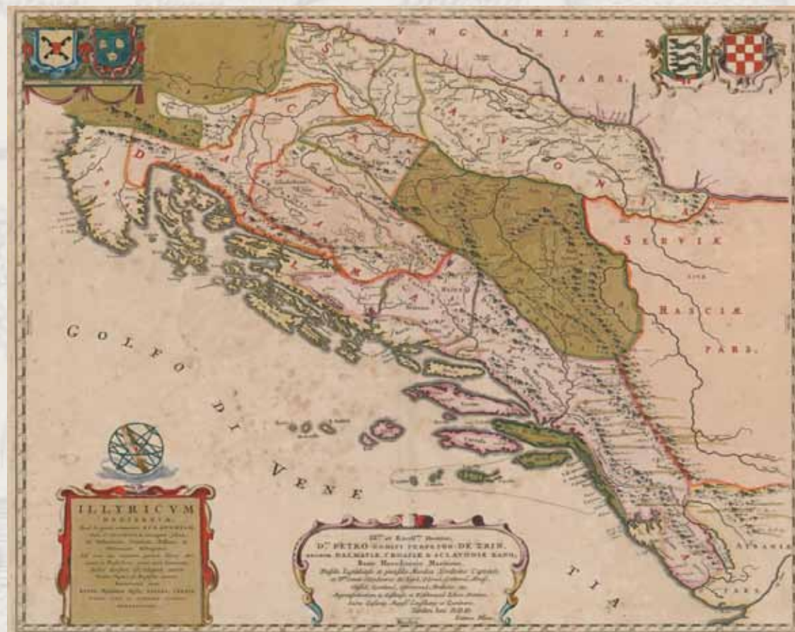
Ioannes Blaeu. Illyricum Hodiernum . Amsterdam, 1669.