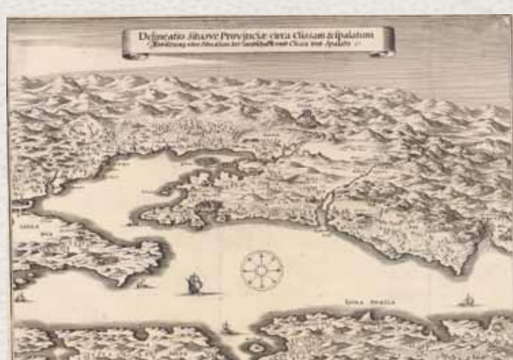
Matthaues Merian. Delineato situsve provinciae circa Clissam et Spalatum . Frankfurt am Main, 1652.