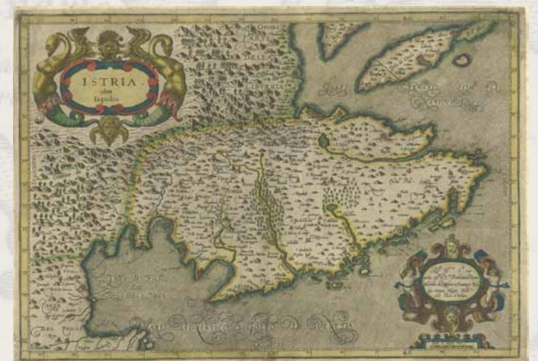
Giovanni Antonio Magini. Istria olim lapidia . Venezia, 1620.