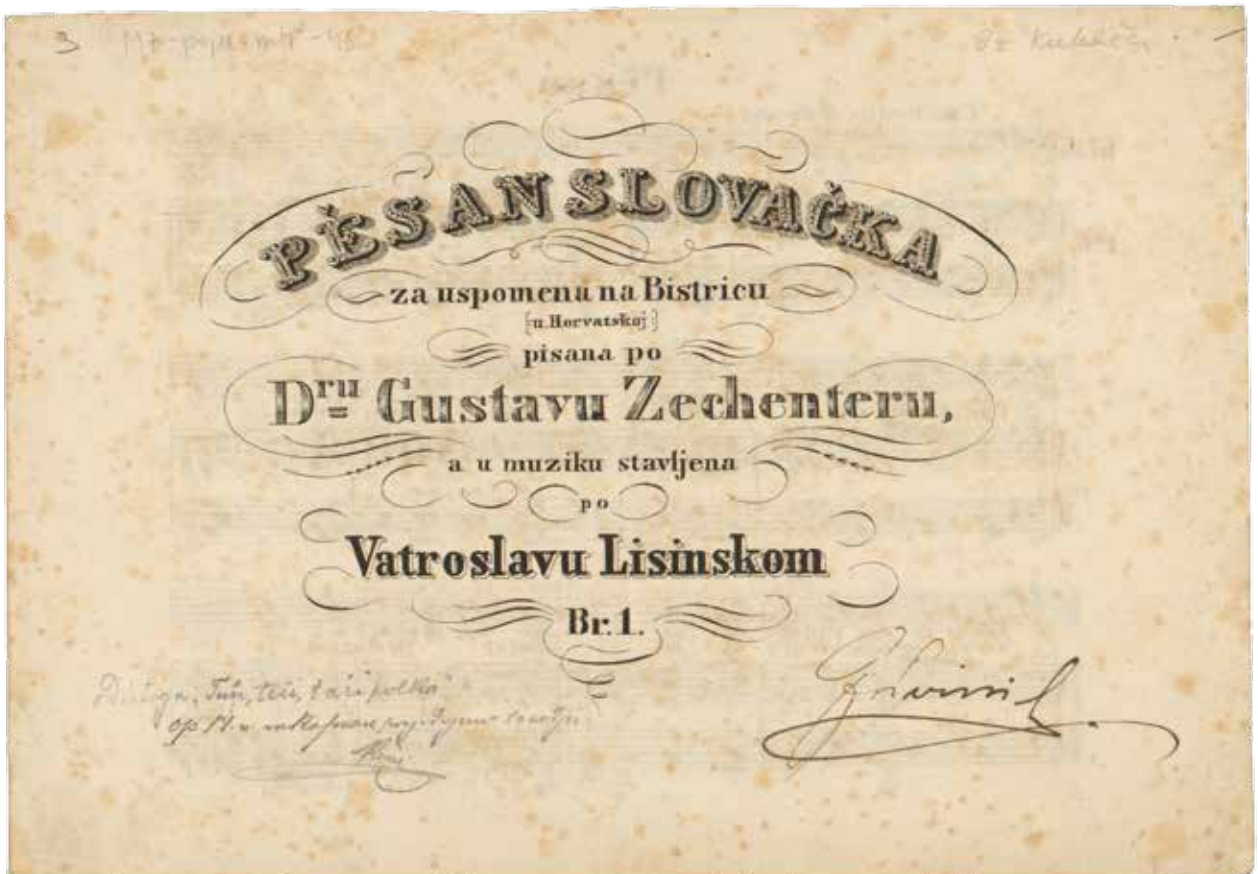
Jedno od najranijih izdanja djela Vatroslava Lisinskoga, objavljeno u Pragu 1847. NSKMZ MZ-popr.4*45