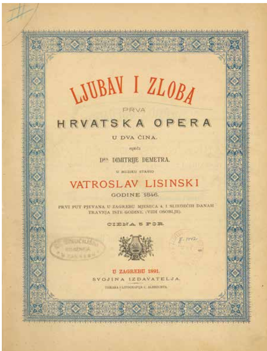
Izdanje klavirskoga izvatka opere Ljubav i zloba , objavljeno 1891. NSKMZ H3-4*-8