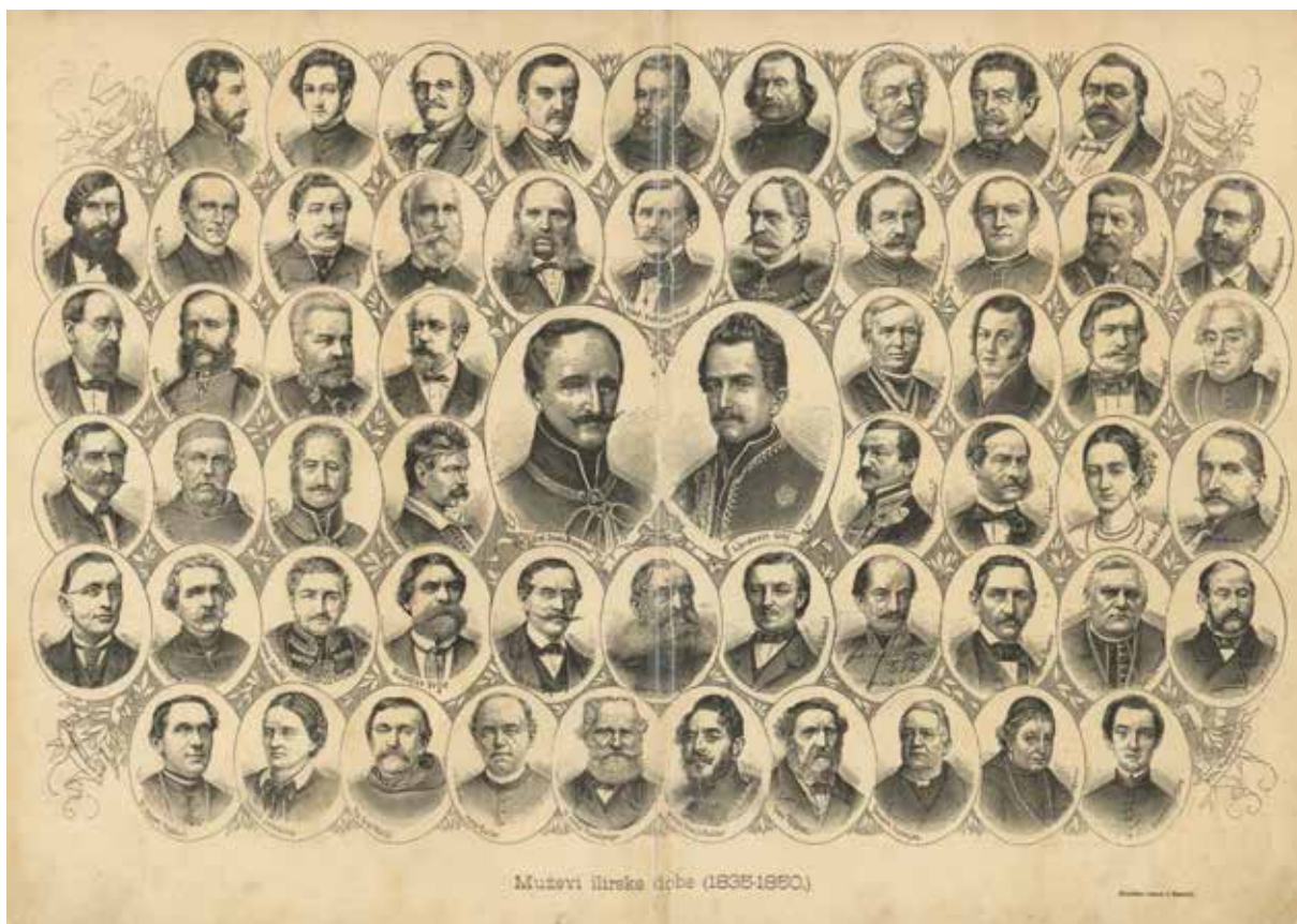
Vatroslav Lisinski među ilircima, reprodukcija iz monografije Slava preporoditeljem!