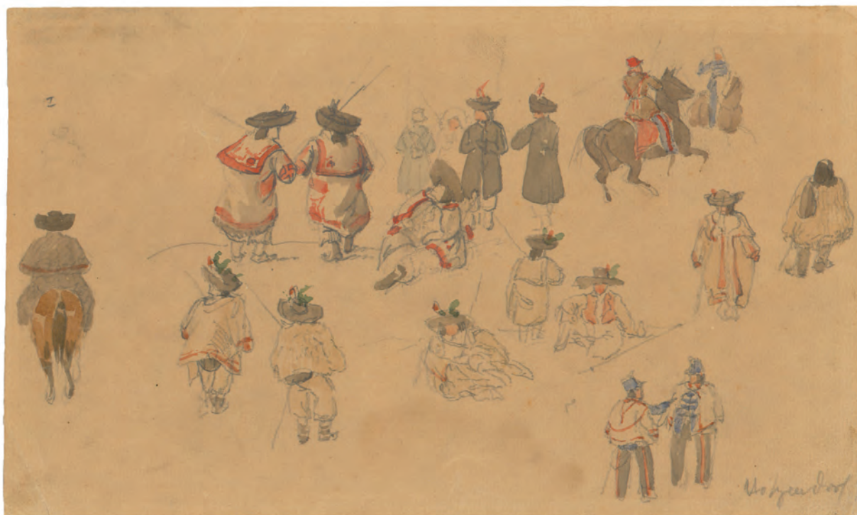
Studija vojnika oko 1845. akvarel, olovka ; 134 x 213 mm. GZAH 199 hoe 29