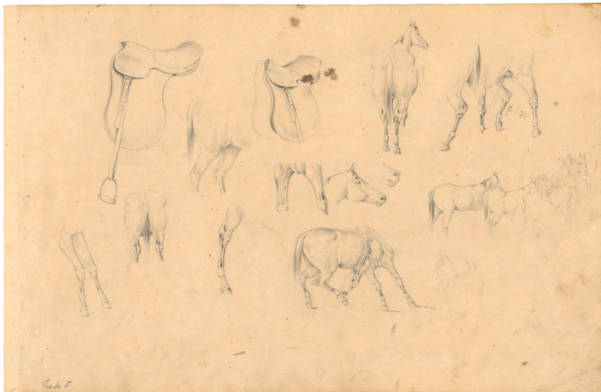
Studije konja 1863. olovka ; 275 x 401 mm. GZAH 175 hoe 5