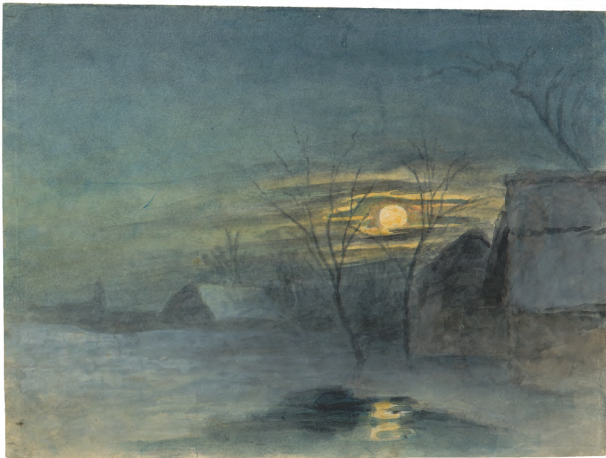
Mjesečina I oko 1845. akvarel ; 189 x 238 mm. GZAH 192 hoe 22