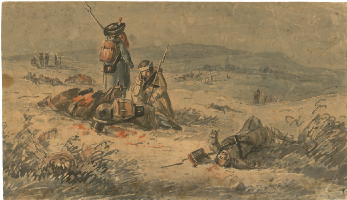
Iz godine 1848 1848. akvarel ; 176 x 290 mm. GZAH 198 hoe 28