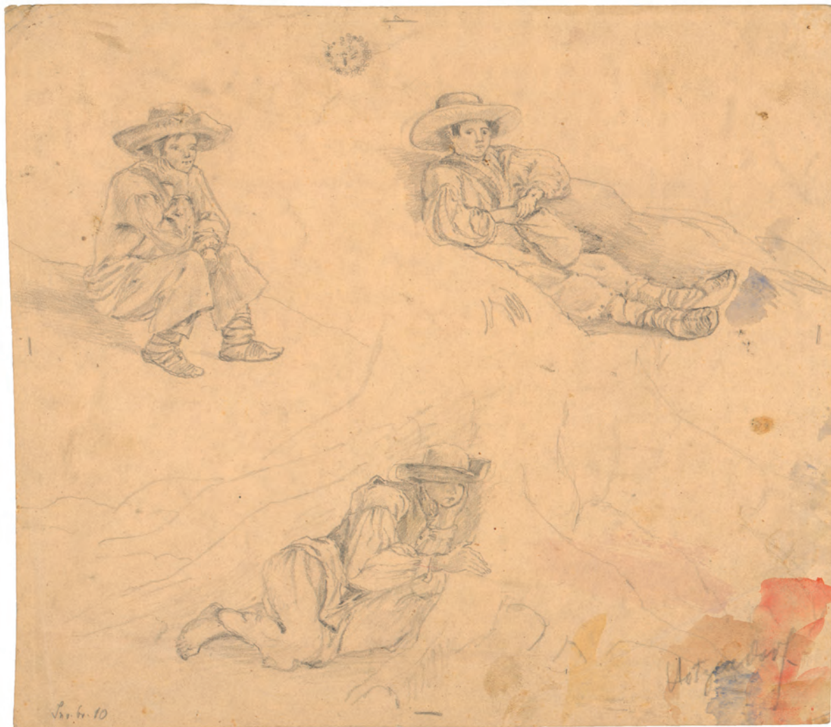
Pastiri oko 1850. olovka ; 213 x 240 mm. GZAH 180 hoe 10