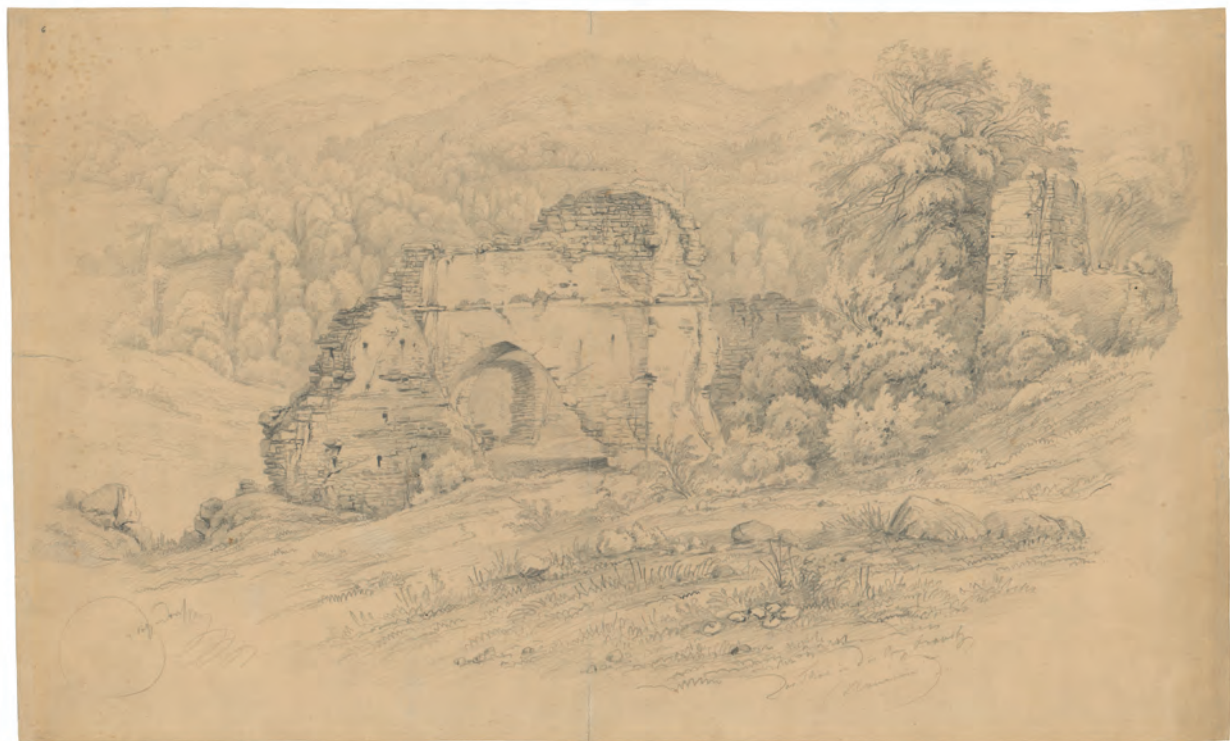
Tor in der Burg Orahovitz oko 1845. olovka ; 345 x 544 mm. GZAH 183 hoe 13