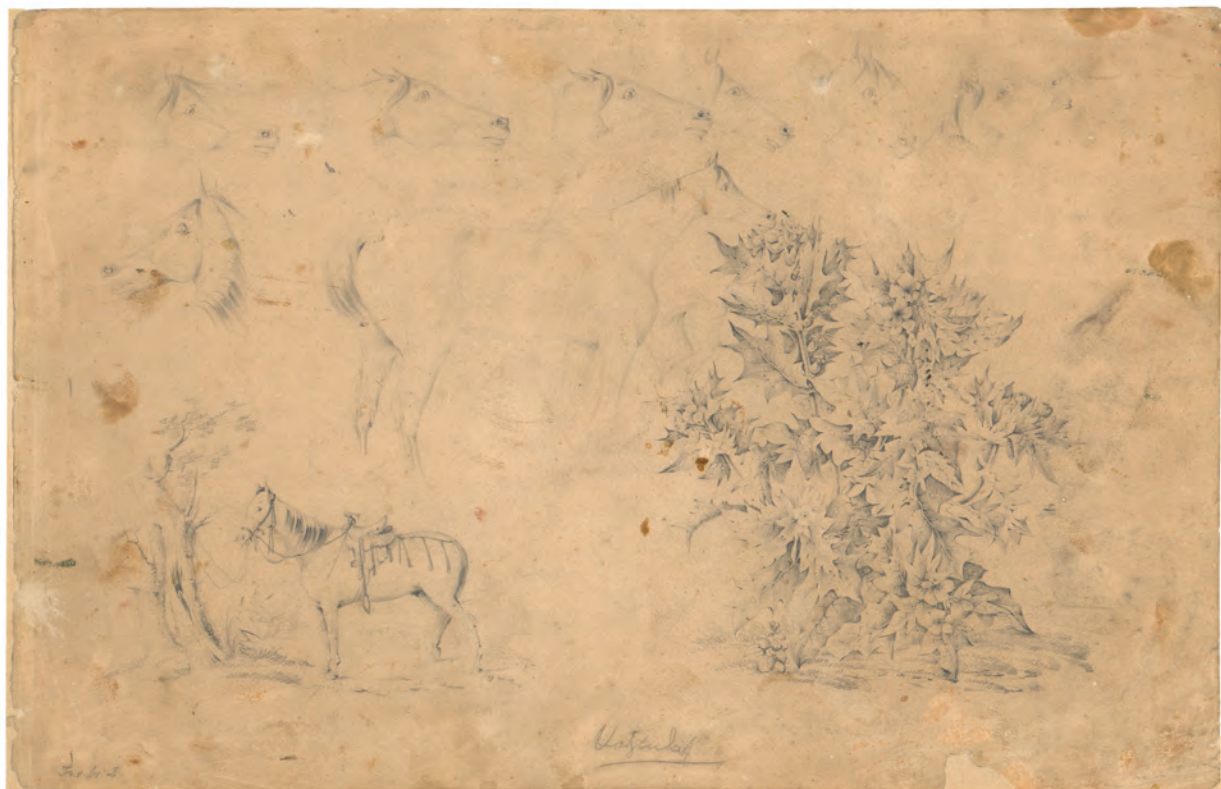
Žbunj lišća i konj 1863. olovka ; 275 x 400 mm. GZAH 172 hoe 2