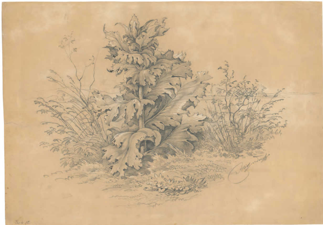
Akantus oko 1857. olovka ; 350 x 473 mm. GZAH 185 hoe 15