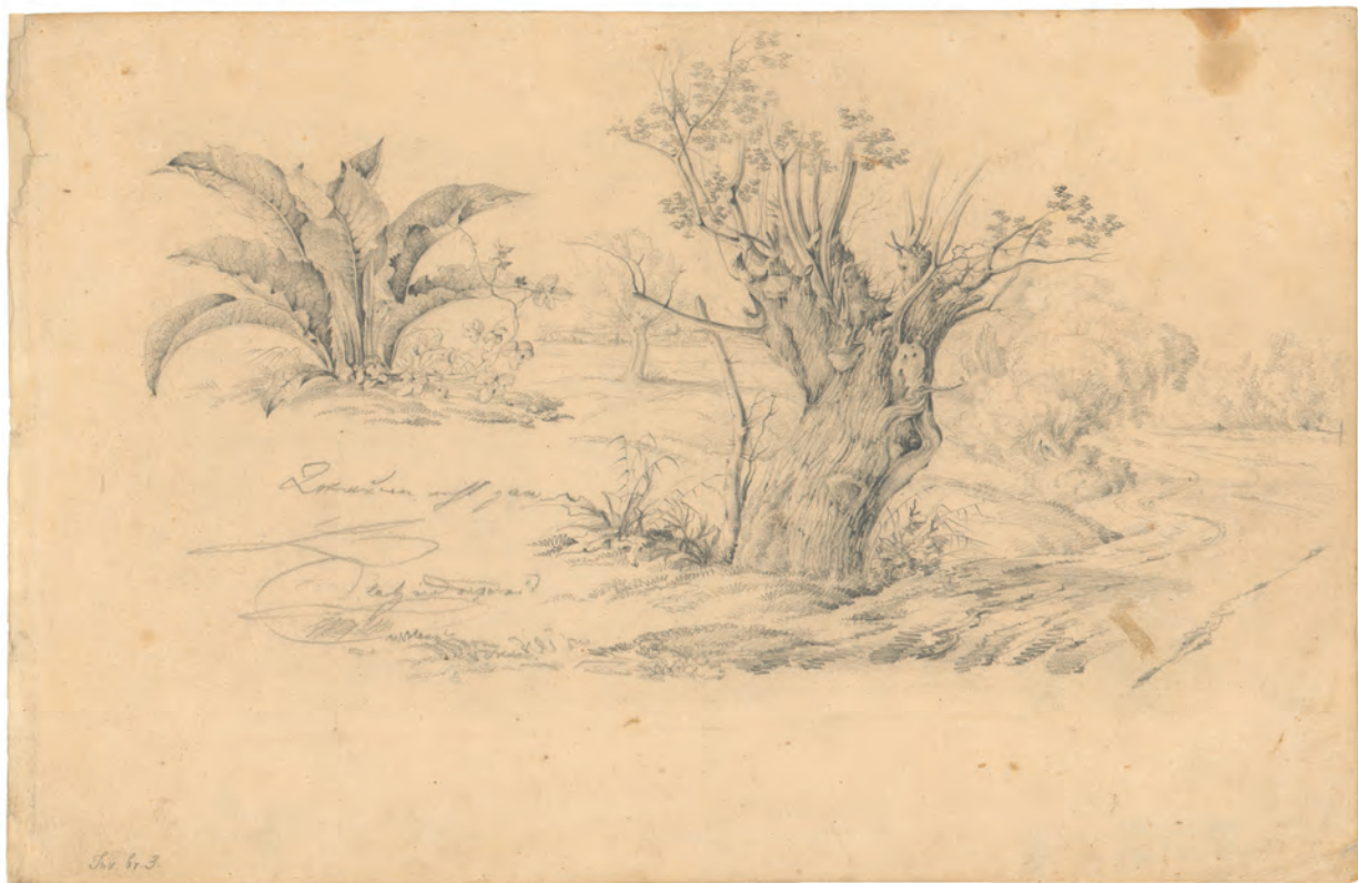
Drvo i akantus 1863. olovka ; 275 x 401 mm. GZAH 173 hoe 3