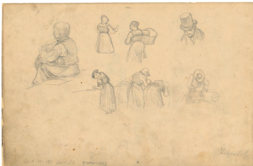
Studija seljaka i seljanki oko 1845. olovka ; 187 x 270 mm. GZAH 195 hoe 25