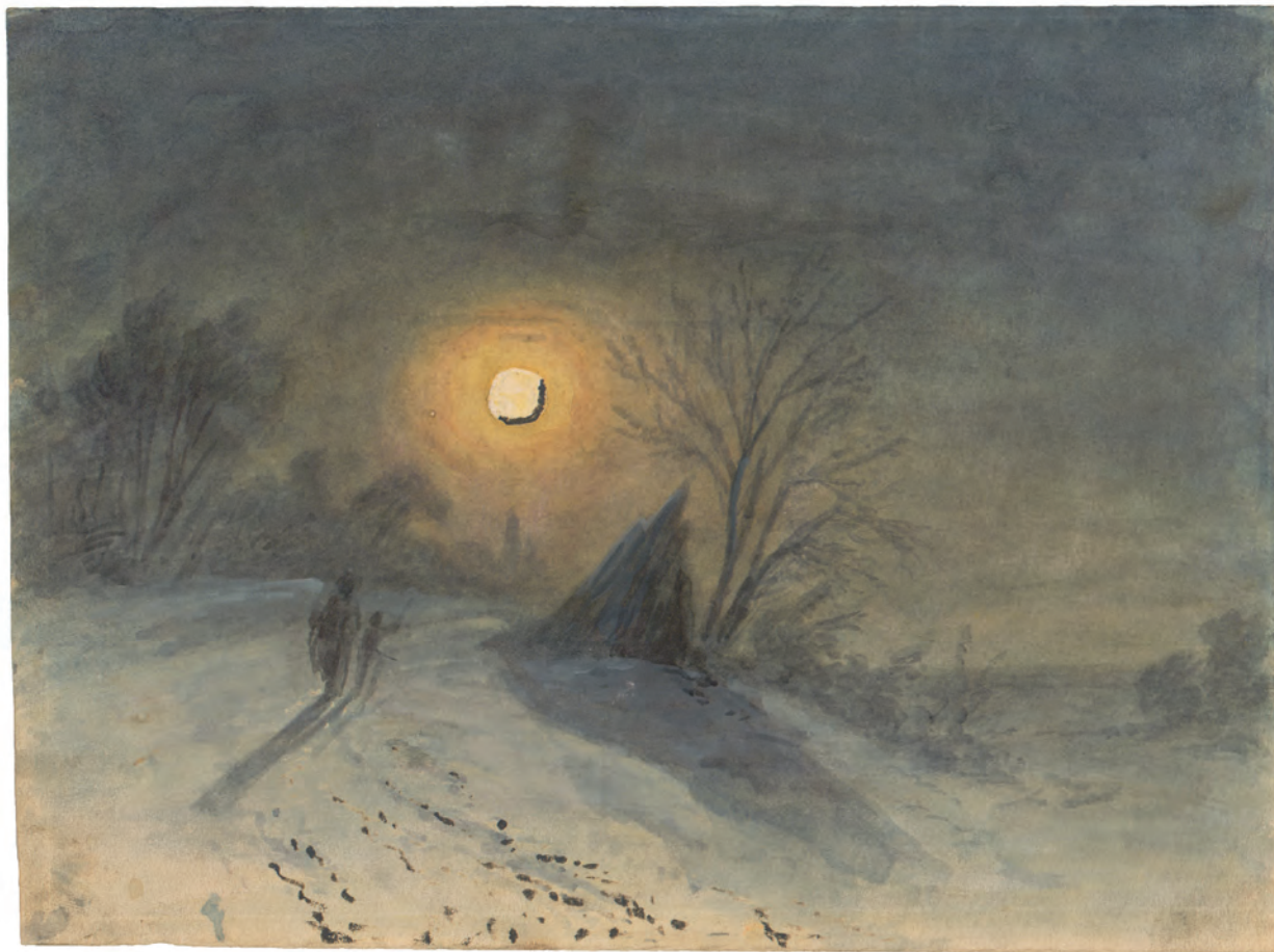
Mjesečina II oko 1845. akvarel ; 192 x 242 mm. GZAH 193 hoe 23