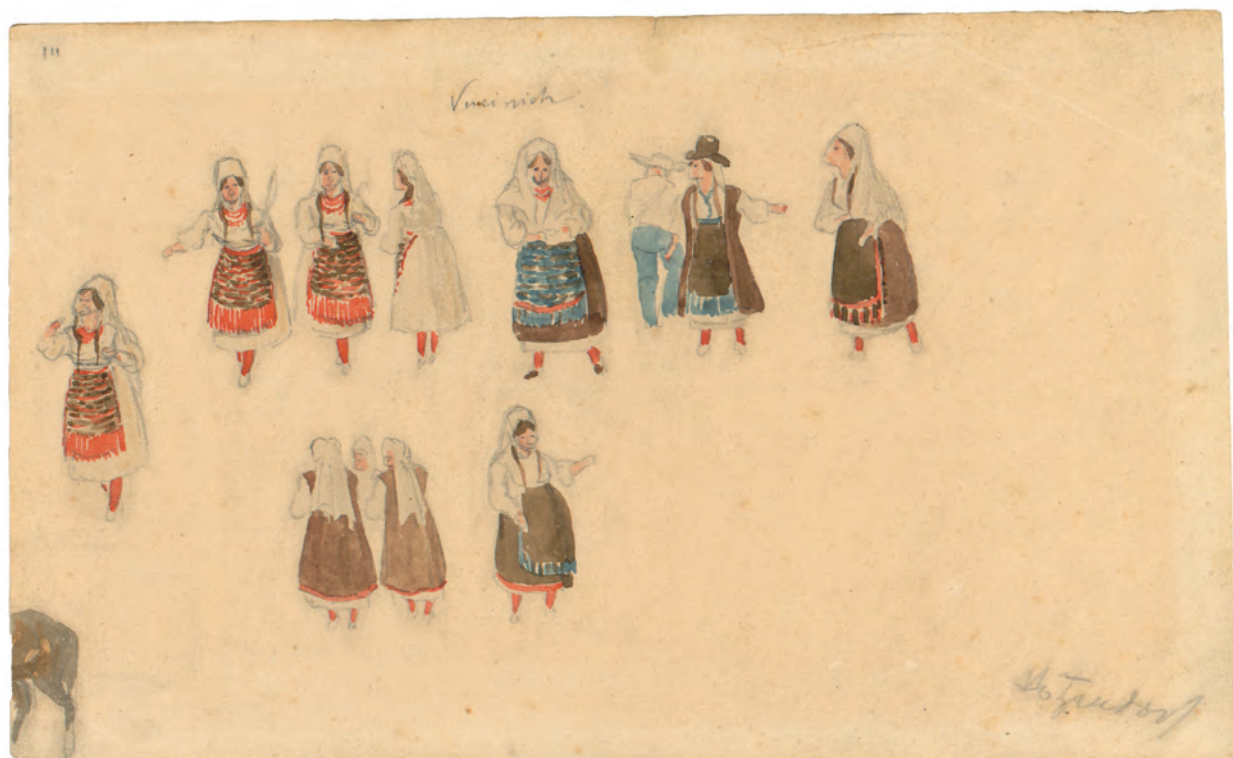
Seljanke iz Vukinića oko 1845. olovka, akvarel ; 137 x 210 mm. GZAH 200 hoe 30