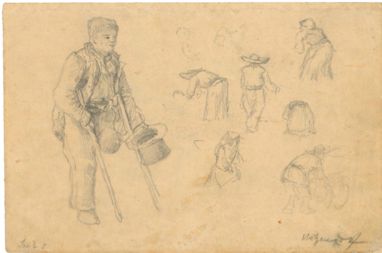
Studije prosjaka i seljaka oko 1845. olovka ; 190 x 268 mm. GZAH 178 hoe 8