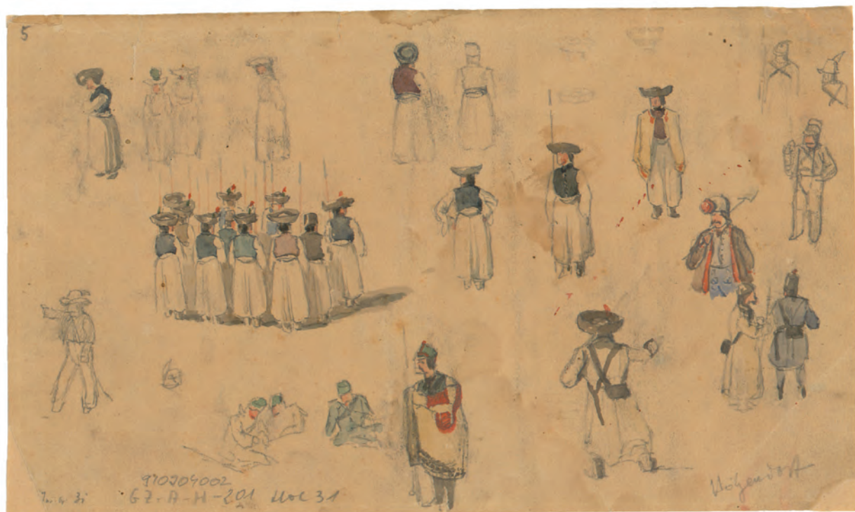
Studija vojnika I oko 1845. akvarel, olovka ; 133 x 211 mm. GZAH 201 hoe 31