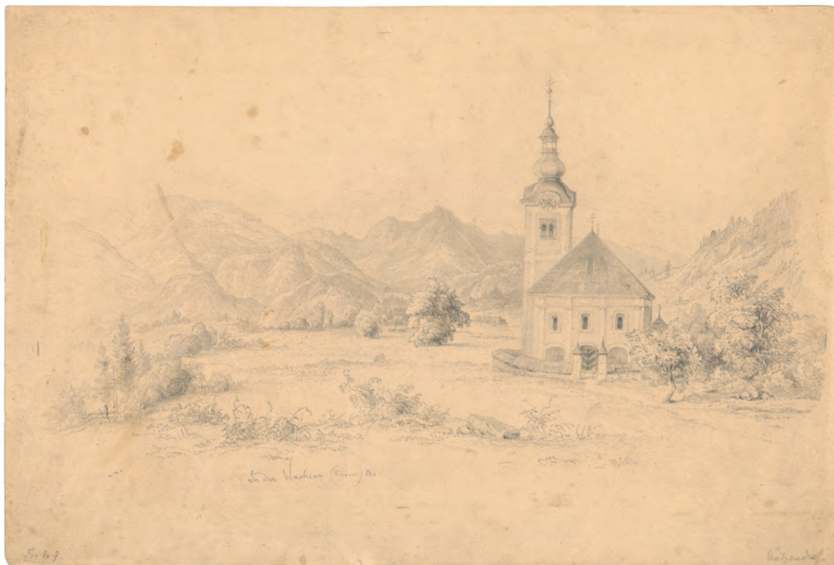
In der Wochein 1843. olovka ; 270 x 378 mm. GZAH 179 hoe 9