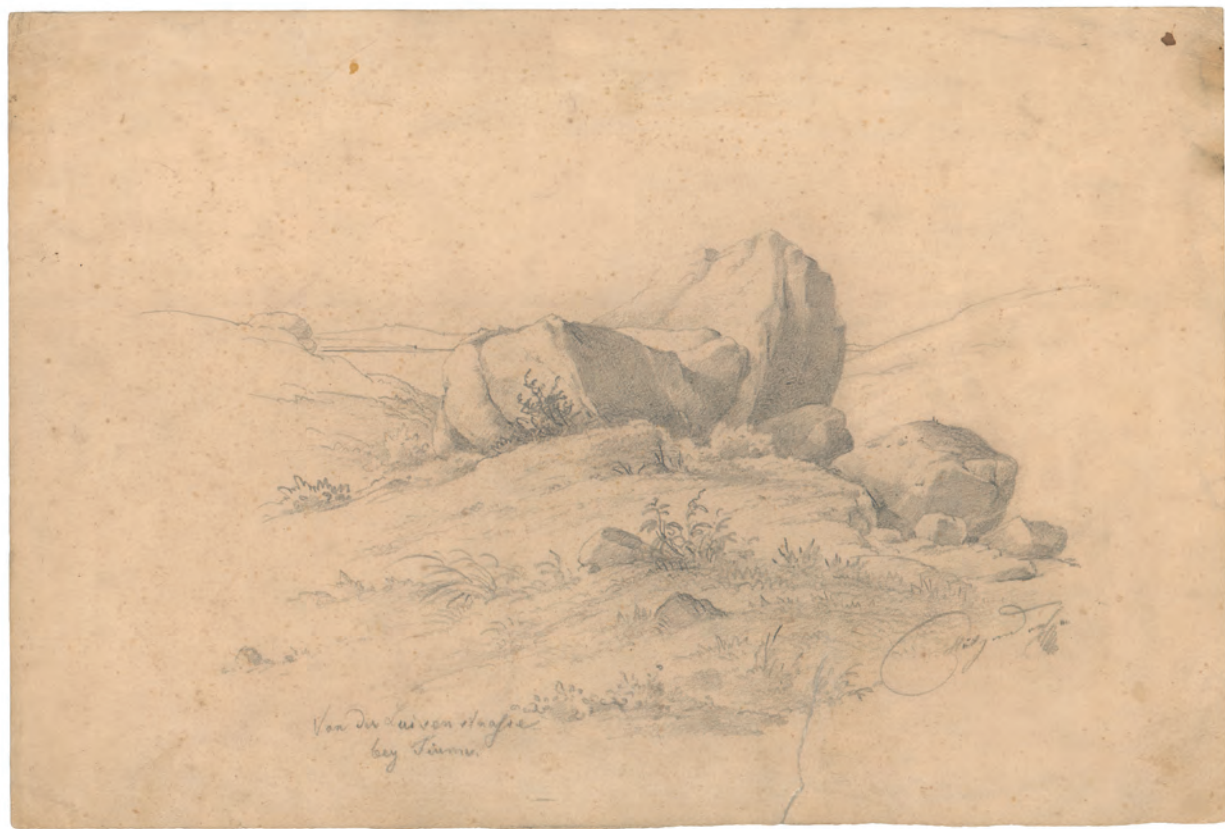
Von der Luisenstrasse oko 1850. olovka ; 273 x 381 mm. GZAH 186 hoe 16