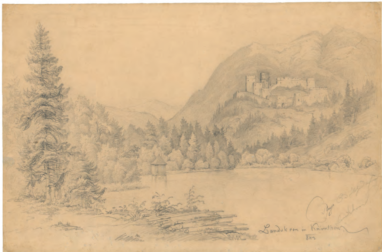
Landskron 1842. olovka ; 302 x 434 mm. GZAH 187 hoe 17