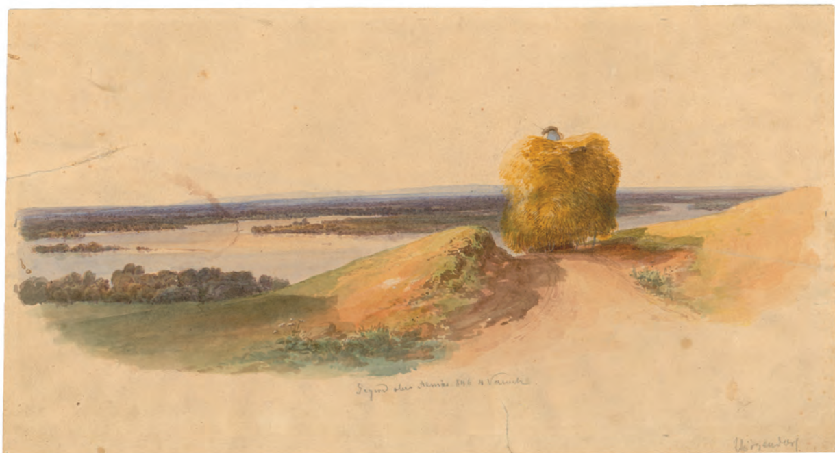
Gegend ober Almas 1846. akvarel ; 196 x 342 mm. GZAH 188 hoe 18