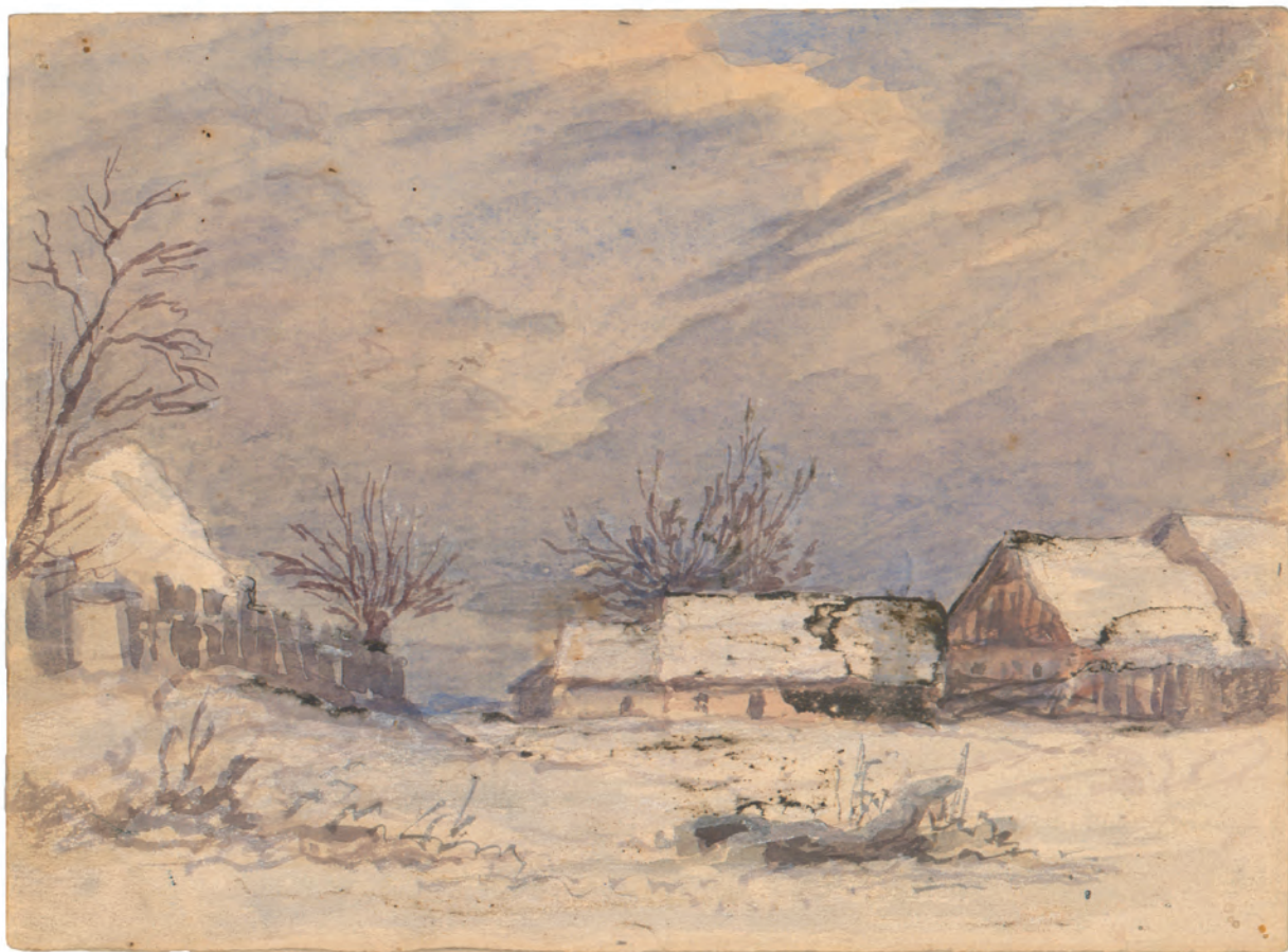
Selo u snijegu oko 1845. akvarel ; 132 x 168 mm. GZAH 191 hoe 21