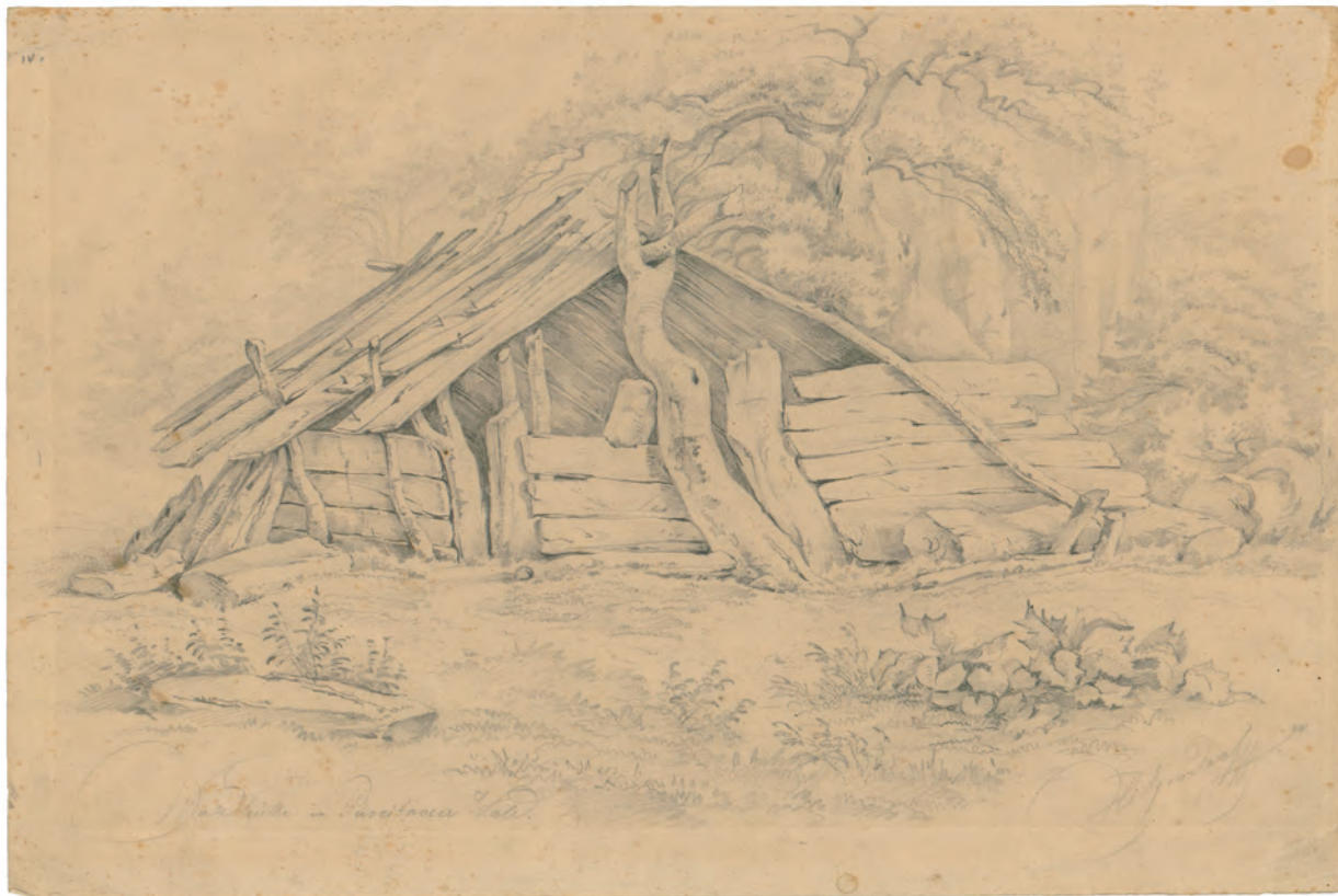
Waldhütte in Punitovcer Wald oko 1845. olovka ; 270 x 383 mm. GZAH 196 hoe 26