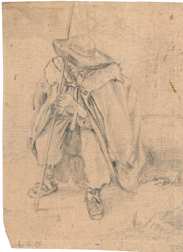
Studija pastira oko 1845. olovka ; 173 x 133 mm. GZAH 197 hoe 27