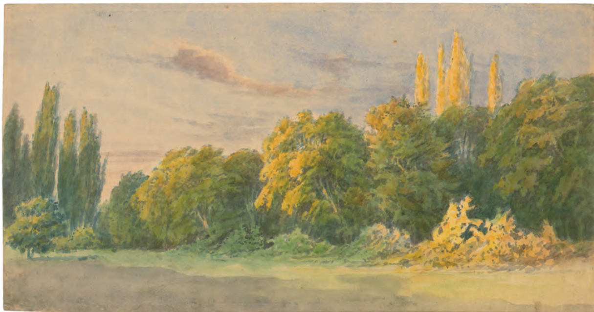
Perivoj 1846. akvarel ; 184 x 331 mm. GZAH 171 hoe 1