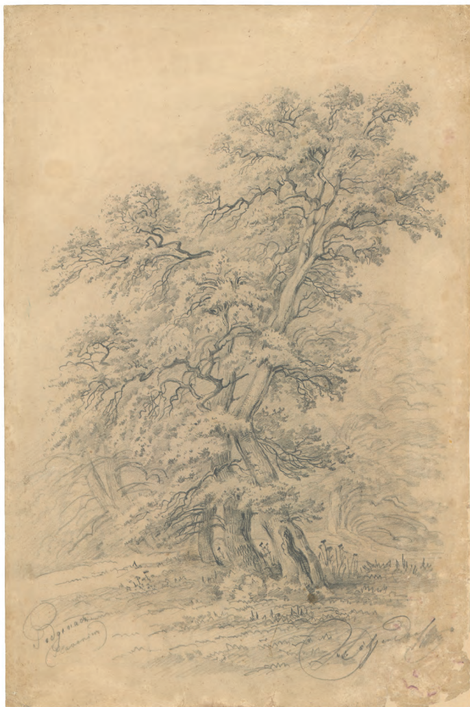
Hrastova šuma oko 1845. olovka ; 540 x 380 mm. GZAH 202 hoe 32