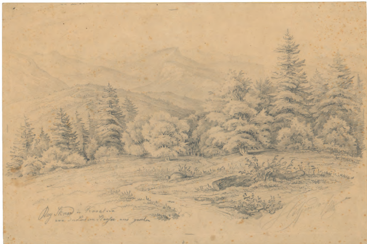
Bey Skrad oko 1845. olovka ; 270 x 382 mm. GZAH 182 hoe 12