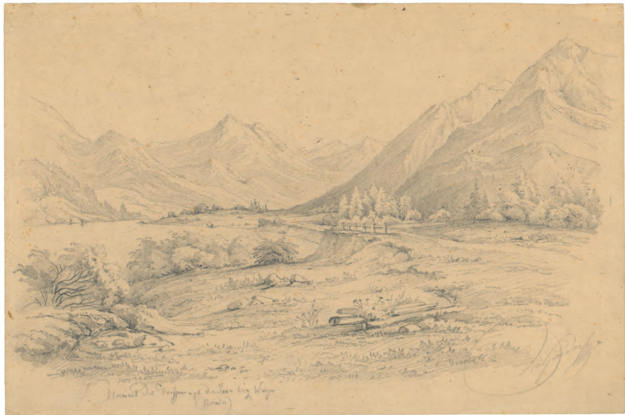
Unweit des Ursprungs der Save oko 1842. olovka ; 270 x 383 mm. GZAH 190 hoe 20