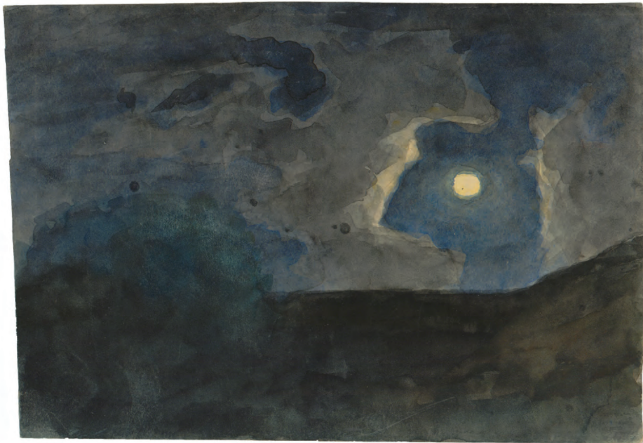
Mjesečina III oko 1845. akvarel ; 163 x 220 mm. GZAH 194 hoe 24