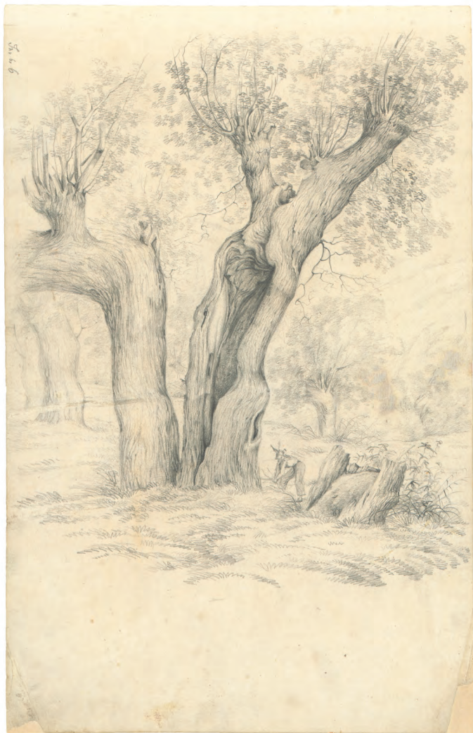
Dva crteža drveta 1863. olovka ; 404 x 274 mm. GZAH 176 hoe 6