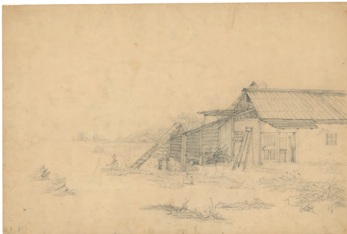
Seoska kuća 1863. olovka ; 272 x 380 mm. GZAH 177 hoe 7