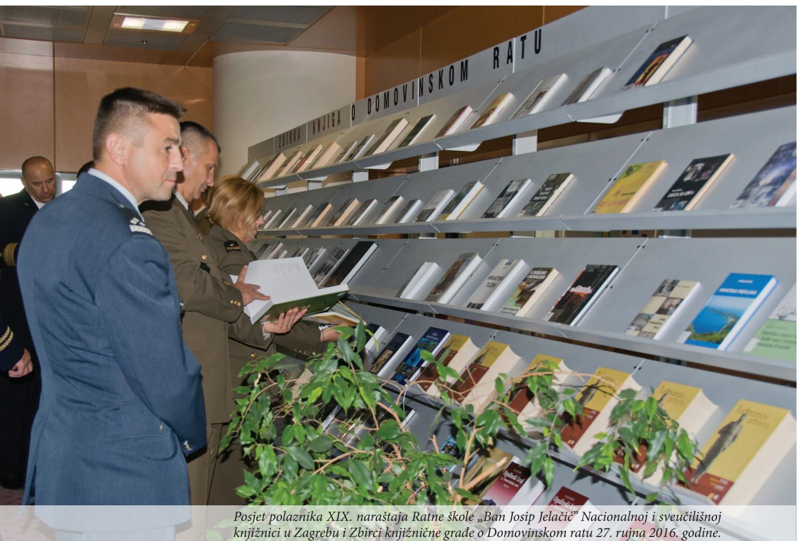
Posjet polaznika XIX. naraštaja Ratne škole „Ban Josip Jelačić” Nacionalnoj i sveučilišnoj knjižnici u Zagrebu i Zbirci knjižnične građe o Domovinskom ratu 27. rujna 2016. godine.