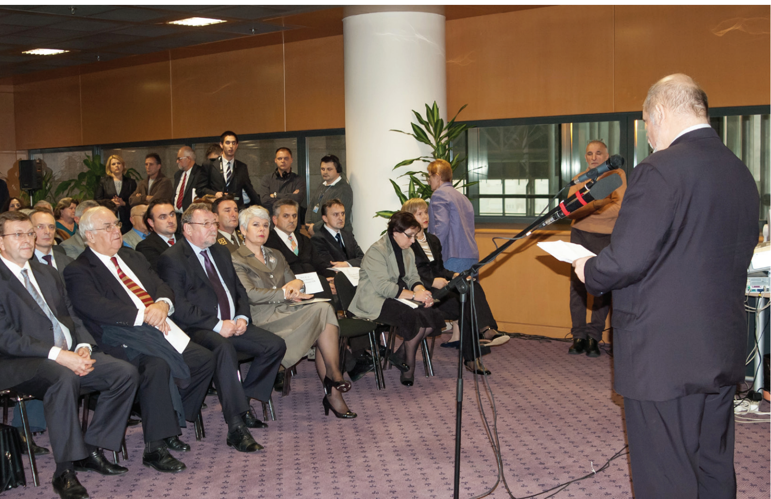
Svečano otvaranje Zbirke knjiga o Domovinskom ratu 10. studenog 2009. godine.